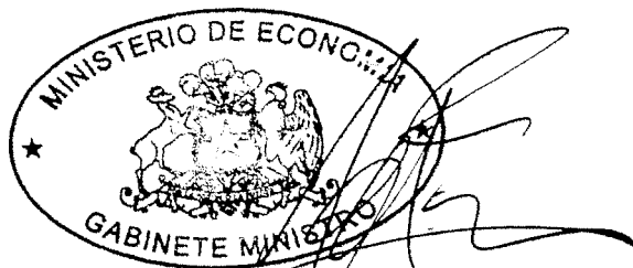
JUAN ANDRÉS FONTAINE TALAVERA MINISTRO DE ECONOMÍA, FOMENTO Y TURISMO

“Por orden del Presidente de la República”